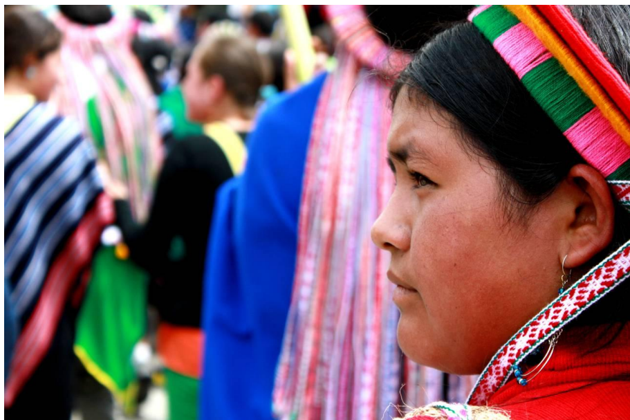
Fotografía de mujer Camëntsá en el Carnaval del Perdón

El manejo ambiental que este pueblo ha realizado del Valle de Sibundoy, junto con sus vecinos y hermanos territoriales los Inga, es un claro ejemplo de la sabiduría que lo acompaña. A través de la experimentación milenaria y el desarrollo de tecnologías propias, estos pueblos han adecuado los suelos donde habitan, superando así limitaciones físicas y químicas del Valle, supliendo el uso de abonos químicos y fungicidas y adaptando especies características de otros pisos térmicos y dando origen a nuevas variedades de plantas (Ramírez de Jara & Pinzón: 1976).